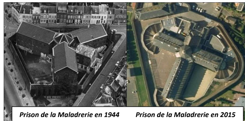
Prison de la Maladrerie en 1944